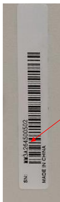
Рисунок 3 – Боковая панель мультиметров цифровых с системой сбора данных и коммутации RIGOL M300