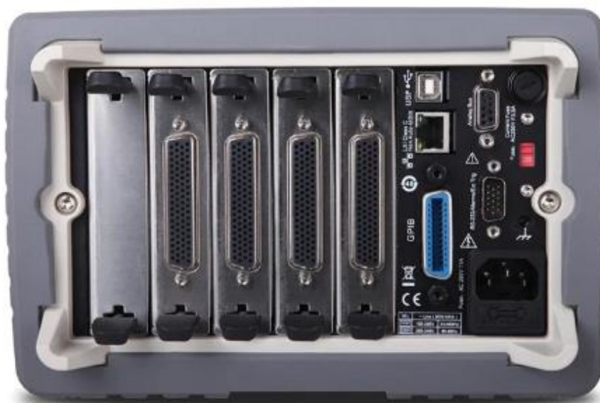
Рисунок 2 – Задняя панель мультиметров цифровых с системой сбора данных и коммутации RIGOL M300