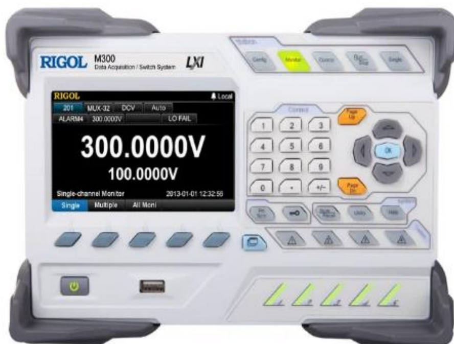
Рисунок 1 – Передняя панель мультиметров цифровых с системой сбора данных и коммутации RIGOL M300